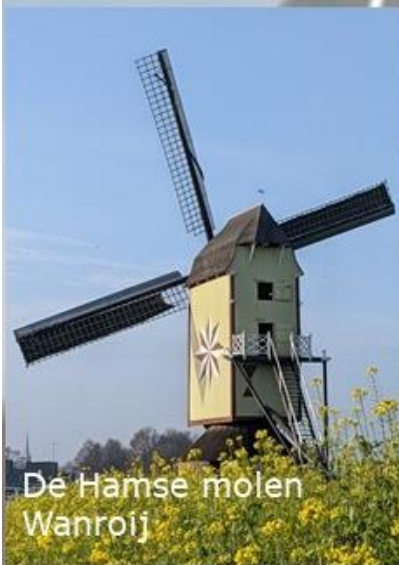
De Hamse molen Wanroij