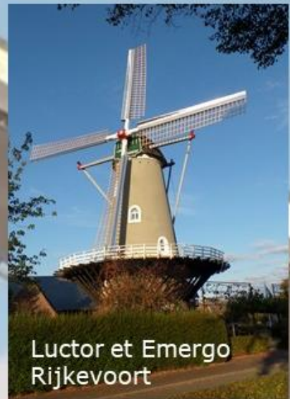
Luctor et Emergo Rijkevoort