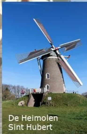
De Heimolen Sint Hubert