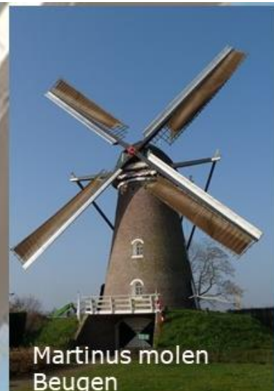
Martinus molen Beugen