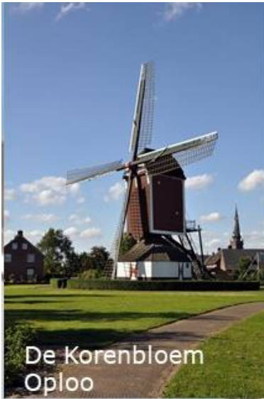
De Korenbloem Oploo